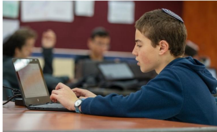
הקולג' הירושלמי | צילום: נאום פיטר

לדבריה, ליוזמה תהיה השפעה אפילו על הברגרות, "ברגע שתלמיד מרגיש כי הוא מסוגל ללמוד קורס אקדמי, הברגרות נעשות אפשריות והתלמידים מבינים את חשיבות ההשקעה עוד בנות הלימודים בתיכון". לדבריה מתסרפת גם ד"ר אסנת כהן, מנהלת האוניברסיטה העברית לנוער: "מדובר על הגששה החוויית האקדמית לכל תלמיד או תלמידה בירושלים שחפצים בכך. פוטנציאל ההשפעה של החיים עצום. מאות תלמידים שניעו לקפס על בסיס שבועי יכירו, ירגישו בבית, וינסו בחוקרים ותלמידי מחקר שישפירו בעיניים נוצצות וילמדו אותם בהתלהבות את הנושאים הכי מרתקים וחשובים בעיניהם".